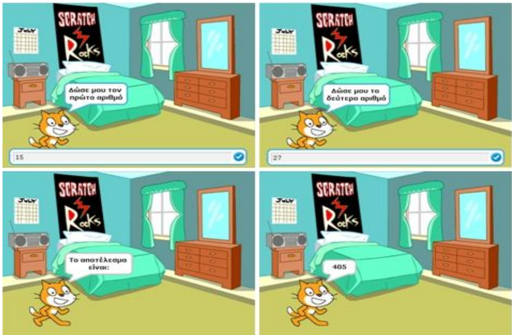
Σχήμα 2: Παράδειγμα εκτέλεσης του προγράμματος στο Scratch