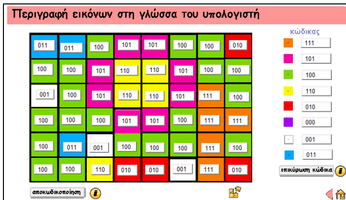
Εικόνα 4: Μικρόκοσμος «περιγραφή εικόνας»

οποία μπορούμε να αναπαριστούμε/κωδικοποιούμε ένα προς ένα. Αυτό θα μπορούσε να αξιοποιηθεί για τη σύνδεση με τις κάθε είδους ψηφιακές οθόνες (τηλεόραση, οθόνες κινητών, φωτογραφικών μηχανών κ.λπ, αλλά και με την τεχνολογία που χρησιμοποιείται στους σαρωτές κ.λπ). Ενδεικτική αξιοποίηση. Ο εν λόγω μικρόκοσμος μπορεί να χρησιμοποιηθεί στα πλαίσια εκπαιδευτικών δραστηριοτήτων που έχουν στόχους όπως οι παρακάτω: Να μπορούν οι μαθητές α) να περιγράφουν πως κωδικοποιούνται οι εικόνες στον υπολογιστή χρησιμοποιώντας ψηφιακή αναπαράσταση, β) να συσχετίζουν την ψηφιοποίηση με την απώλεια σε ακρίβεια στην αναπαράσταση και την απώλεια ποιότητας, γ) να κατανοούν τη σημασία «οικονομικών» κωδικών αναπαράστασης (όσο το δυνατόν πιο μικρό βάθος χρώματος), δ) να μπορούν να δημιουργούν «οικονομικούς κώδικες», ε) να συσχετίζουν το μεγάλο βάθος χρώματος(μεγάλη χρωματική λεπτομέρεια) με μεγάλο μέγεθος στη μνήμη, στ) να κατανοήσουν πως οι εικόνες που βλέπει στις διάφορες οθόνες στηρίζονται στην ψηφιακή αναπαράσταση (δεν υπάρχει η έννοια του συνεχόμενου), ζ) να συνεργαστούν με τους συμμαθητές του για κοινή δημιουργία κώδικα και επίλυση τυχόν προβλημάτων.