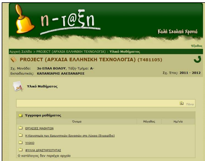
Εικόνα 2: Το περιβάλλον e-class του Π.Σ.Δ. για την ερευνητική εργασία

ηλεκτρονική τάξη, ειδικά για την ερευνητική εργασία ( http://eclass.sch.gr/courses/T481105/ ).