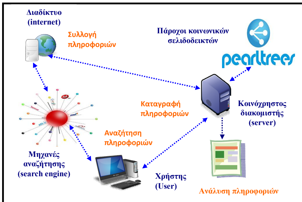
Σχήμα 1: Από την αναζήτηση στους συλλογικούς σελιδοδείκτες (social bookmarks)

Μετά τη συλλογή των πληροφοριών από τους μαθητές με τη βοήθεια διαδικτυακών εργαλείων (μηχανές αναζήτησης), οι πληροφορίες που συλλέχτηκαν έπρεπε να καταγραφούν και να αναλυθούν (σχήμα 1). Το περιβάλλον Τ.Π.Ε. που χρησιμοποιήθηκε για την καταγραφή και την ανάλυση των πληροφοριών, αφορούσε το εργαλείο οπτικοποιημένου τρόπου οργάνωσης των σελιδοδεικτών «Pearltrees».