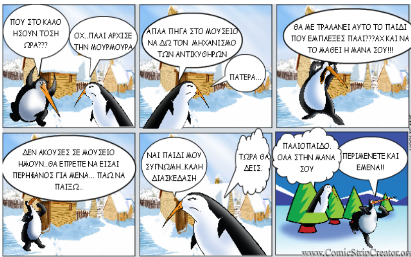
Εικόνα 3: Εργασία μαθήτριας με το λογισμικό Comic Strip Creators

Ο τρόπος αναπαράστασης νέων γνώσεων, από τα μέλη των ομάδων της ερευνητικής εργασίας που αφορούσαν την πέμπτη φάση, συνδυάστηκε με ένα καινοτόμο εργαλείο που ενθουσίασε τα παιδιά, προσφέροντας την ευκαιρία να εκφραστούν και να διασκεδάσουν. Το εργαλείο αυτό, αφορούσε το ψηφιακό κόμικ και το λογισμικό Comic Strip Creators ( http://www.comicstripcreator.org ), που ανήκει στην κατηγορία σύντομων κόμικς. Τα βήματα για την υλοποίησή τους εργαστηρίου που αφορούσε το ψηφιακό κόμικ ήταν: α) παρουσίαση λογισμικού από τον εκπαιδευτικό και εξοικείωση από τους μαθητές σε περιβάλλον εργαστηρίου, β) σχεδιασμός αφήγησης και οργάνωσης της ιστορίας, γ) σχεδιασμός της δράσης σε καρέ (frame), δ) μετατροπή σεναρίου σε κόμικ, ε) αποθήκευση – εξαγωγή κόμικ (Παπανικολάου, Μητροπούλου & Ρετάλης 2010).