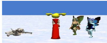
Σχήμα 2: Ένα στιγμιότυπο από το περιβάλλον Storytelling Alice

προγραμματισμού, γεγονός που διευκολύνει τους αρχάριους προγραμματιστές και ιδιαίτερα τα κορίτσια. Το περιβάλλον Storytelling Alice είναι παρόμοιο με το περιβάλλον Alice 2.0., ωστόσο το περιβάλλον Storytelling Alice σχεδιάστηκε για να χρησιμοποιηθεί από παιδιά γυμνασίου και λυκείου, προσφέροντας υψηλότερου επιπέδου κινούμενα σχέδια. Για παράδειγμα, από το περιβάλλον Storytelling Alice προσφέρονται επιπλέον χαρακτήρες (π.χ. νεράιδες και τυπικοί χαρακτήρες μαθητών) και επιπλέον έτοιμες προγραμματισμένες συμπεριφορές (π.χ. χορός, φιλία, ομιλία) που απευθύνονται σε μαθητές γυμνασίου.